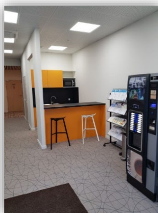
Espace détente et pause midi