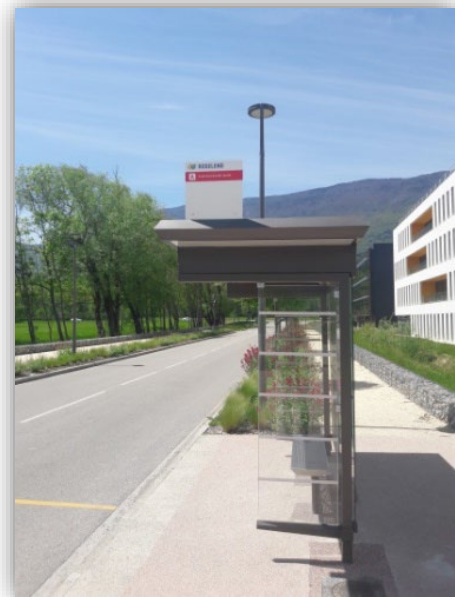
Ligne bus A Roselend