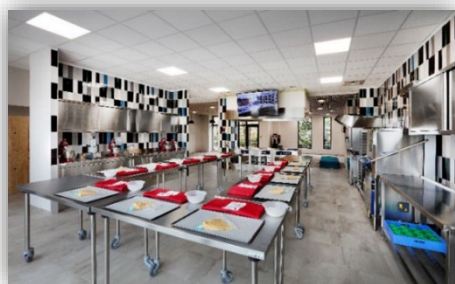
Cuisine d'application 200m 2