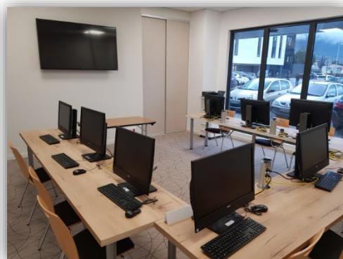
Salle formation informatique 9 postes équipés en fibre optique