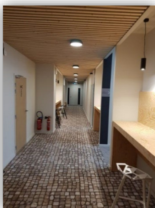
Espace formation indépendant 200m 2