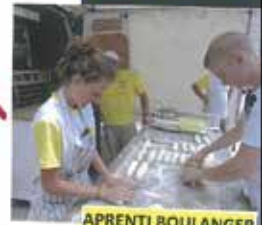
APRENTI BOULANGER ET BOULANGERE