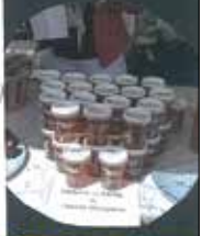
MIEL DU TERROIR