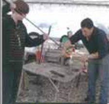
SOUFFLEUR DE VERRE