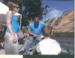
CHARLY L'ARTISTE DU CHAUME