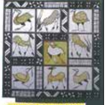
ŒUVRE DE VERRIER

Parcours et villes étapes définis sous réserve des accords administratifs.